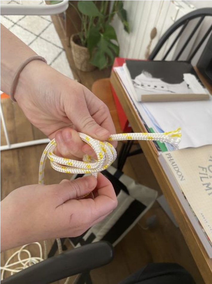
Taille de cet aperçu : 450 × 600 pixels. Fichier d'origine (3 024 × 4 032 pixels, taille du fichier : 2,05 Mio, type MIME : image/jpeg) Corps__corde_IMG_8442