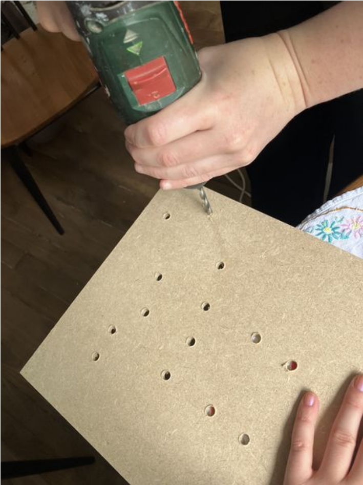
Taille de cet aperçu : 450 × 600 pixels. Fichier d'origine (3 024 × 4 032 pixels, taille du fichier : 3,05 Mio, type MIME : image/jpeg) Corps__corde_IMG_3675