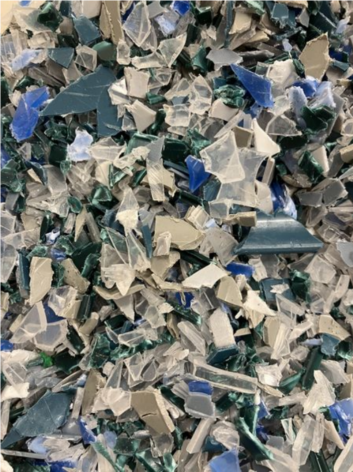
Taille de cet aperçu : 450 × 600 pixels. Fichier d'origine (3 024 × 4 032 pixels, taille du fichier : 3,77 Mio, type MIME : image/jpeg) Corps__corde_IMG_3200