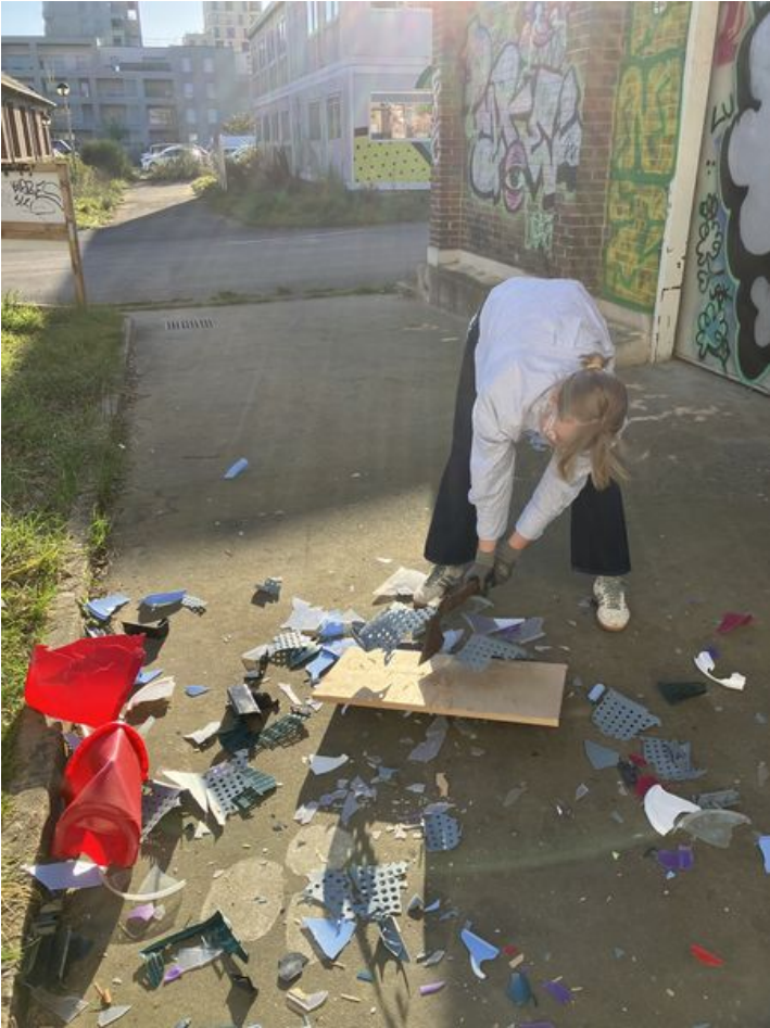
Taille de cet aperçu : 450 × 600 pixels. Fichier d'origine (3 024 × 4 032 pixels, taille du fichier : 3,59 Mio, type MIME : image/jpeg) Corps__corde_IMG_3191