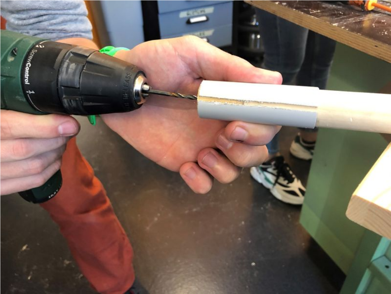
Taille de cet aperçu : 800 × 600 pixels. Fichier d'origine (4 032 × 3 024 pixels, taille du fichier : 1,57 Mio, type MIME : image/jpeg) Comete_Attack_mat_guide