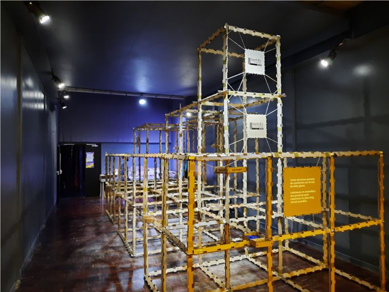
Taille de cet aperçu : 800 × 600 pixels. Fichier d'origine (4 000 × 3 000 pixels, taille du fichier : 4,7 Mio, type MIME : image/jpeg) Circuit_de_bille_g_ant_20231116_183706