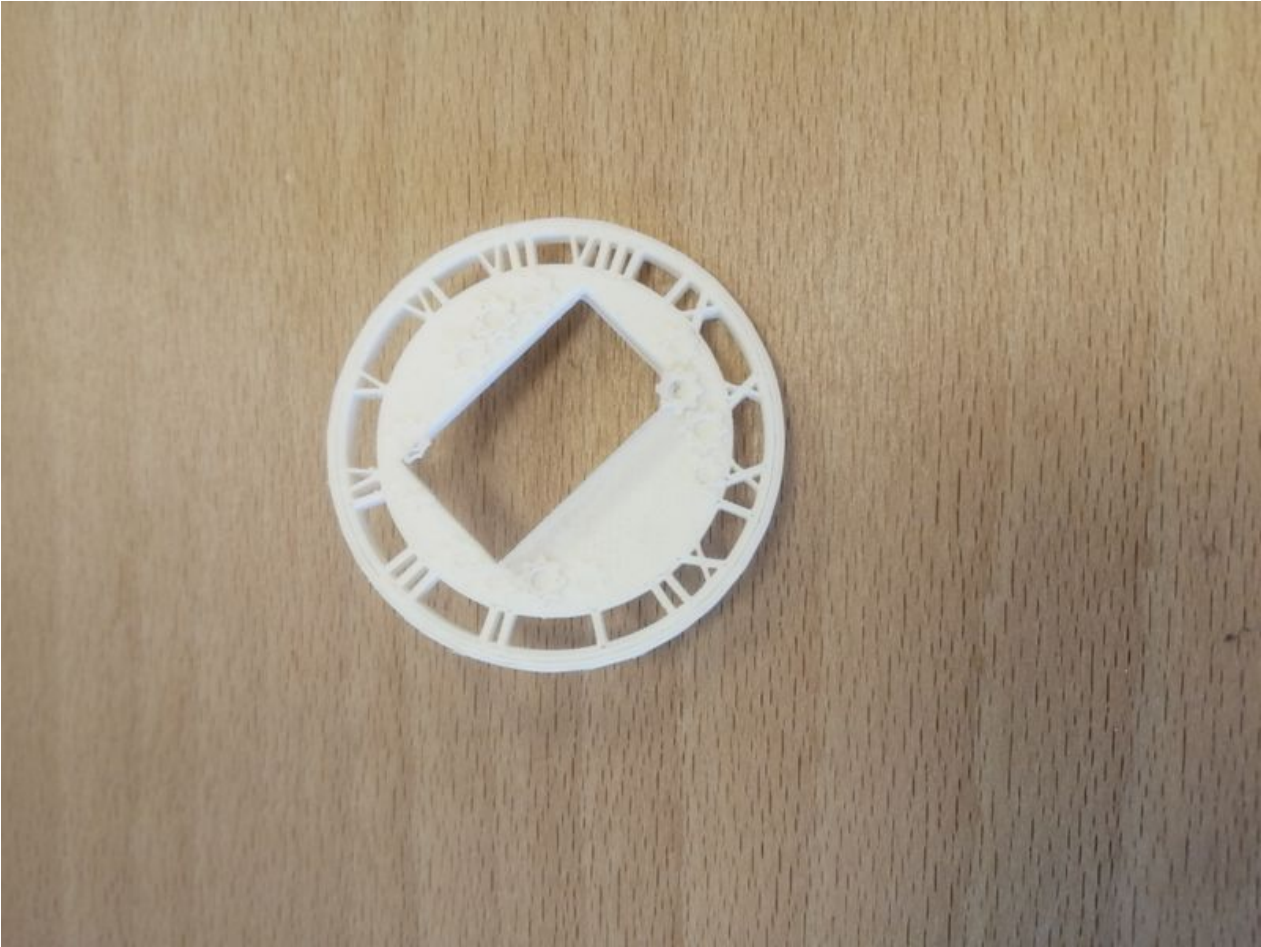
Taille de cet aperçu : 800 × 600 pixels. Fichier d'origine (4 160 × 3 120 pixels, taille du fichier : 3,5 Mio, type MIME : image/jpeg) Bentolux_Steampunk_Cadran_cran