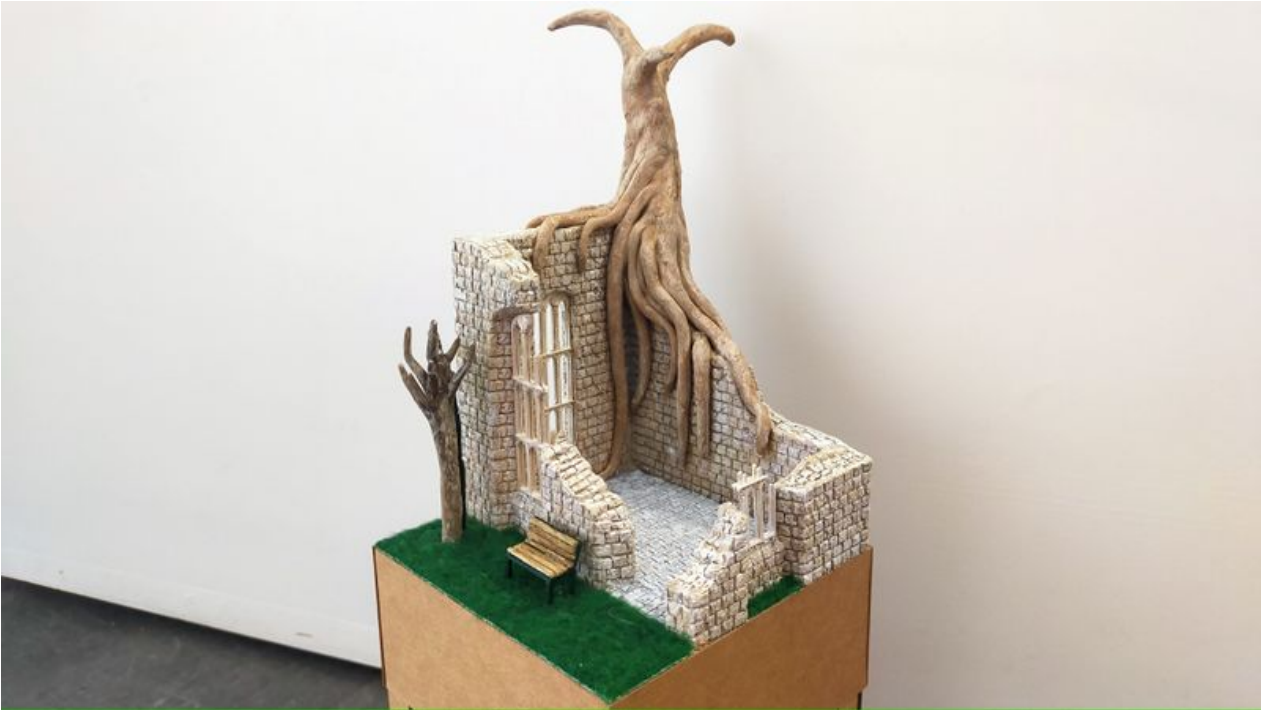
Taille de cet aperçu :800 × 450 pixels. Fichier d'origine (4 000 × 2 250 pixels, taille du fichier : 1,6 Mio, type MIME : image/jpeg) Bentolux_-_vestige_IMG20220616095538