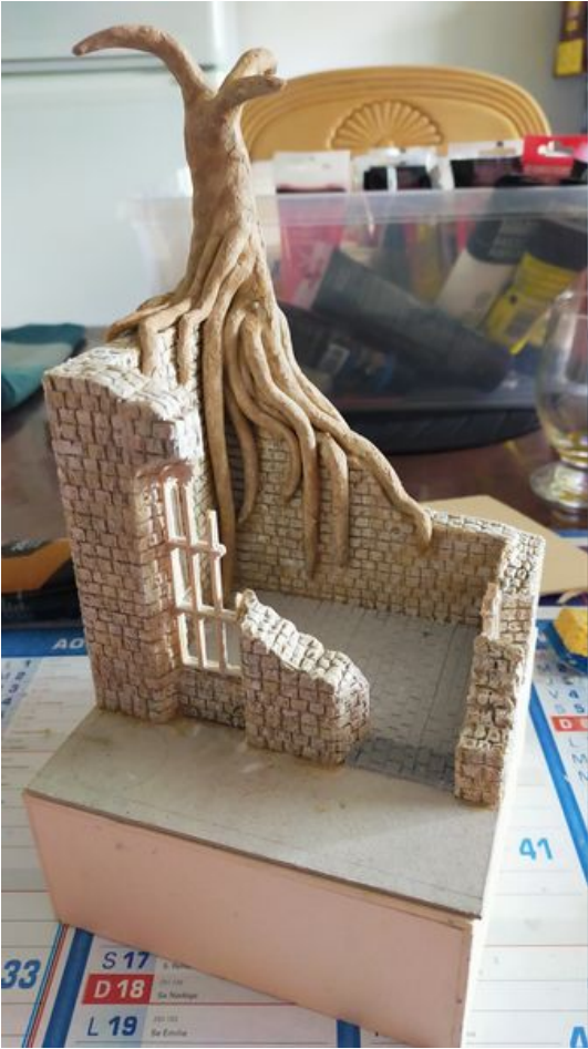
Taille de cet aperçu : 337 × 599 pixels. Fichier d'origine (2 250 × 4 000 pixels, taille du fichier : 2,18 Mio, type MIME : image/jpeg) Bentolux_-_vestige_IMG20220607095654