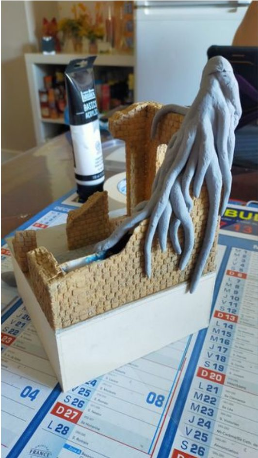
Taille de cet aperçu :337 × 599 pixels. Fichier d'origine (2 250 × 4 000 pixels, taille du fichier : 2,5 Mio, type MIME : image/jpeg) Bentolux_-_vestige_IMG20220606110214