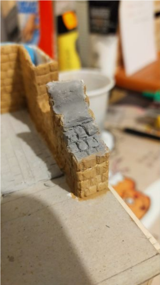
Taille de cet aperçu : 337 × 599 pixels. Fichier d'origine (2 250 × 4 000 pixels, taille du fichier : 1,66 Mio, type MIME : image/jpeg) Bentolux_-_vestige_IMG20220601211507