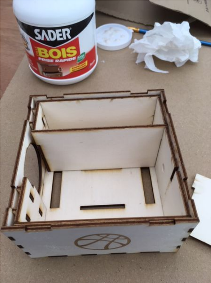
Taille de cet aperçu : 450 × 600 pixels. Fichier d'origine (480 × 640 pixels, taille du fichier : 99 Kio, type MIME : image/jpeg) Bento_Strange_3