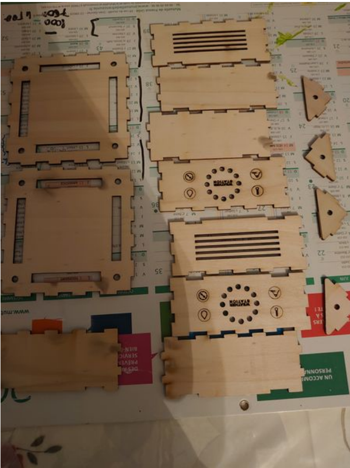
Taille de cet aperçu : 450 × 600 pixels. Fichier d'origine (3 024 × 4 032 pixels, taille du fichier : 3,36 Mio, type MIME : image/jpeg) BENTORAMIDE_DSC_0033