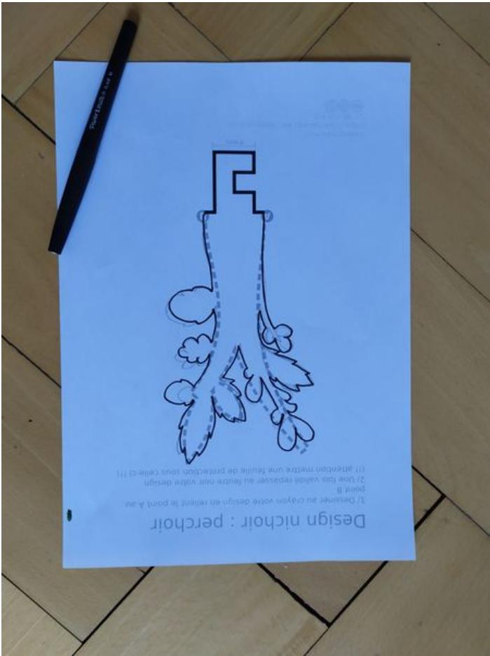
Taille de cet aperçu : 450 × 600 pixels. Fichier d'origine (3 000 × 4 000 pixels, taille du fichier : 3,35 Mio, type MIME : image/jpeg) Atelier_nichoir_IMG_20200323_174455