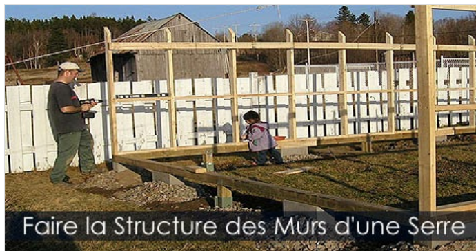
Faire la Structure des Murs d'une Serre