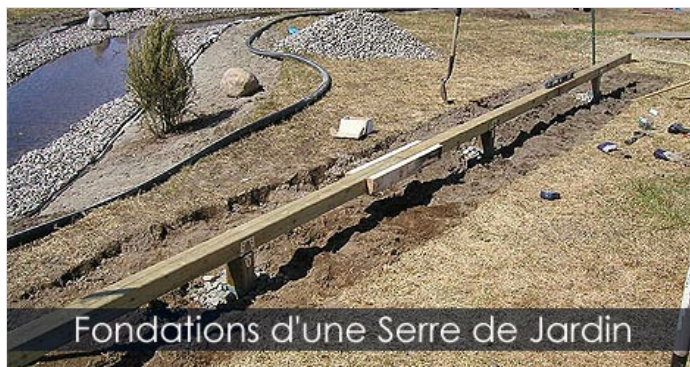
Fondations d'une Serre de Jardin