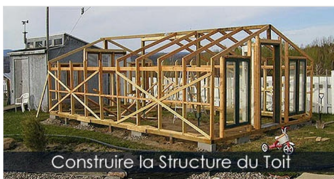
Construire la Structure du Toit