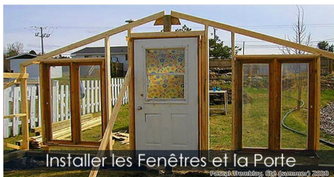
Installer les Fenêtres et la Porte