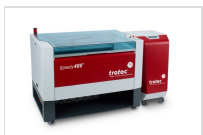
Trotec Speedy 400