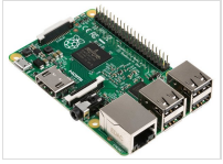
Raspberry Pi III