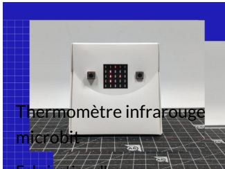
Thermomètre infrarouge microbit

Fabrication d'un thermomètre infrarouge ave..