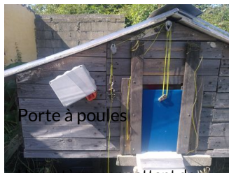
Porte à poules