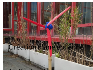
Création d'une éolienne

Atelier de création numérique et plastique.