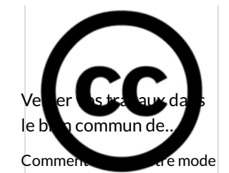
Veillez vos travaux dans le bien commun de...