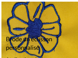
Brode un écusson personnalisé

Atelier de création numérique et plastique.