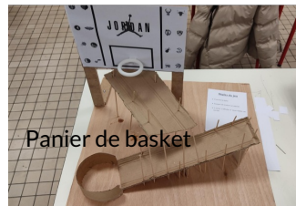
Panier de basket