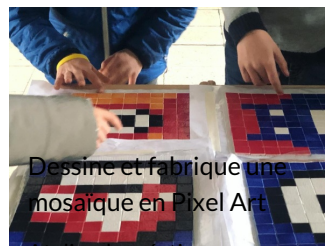
Dessine et fabrique une mosaïque en Pixel Art

Atelier de création numérique et plastique