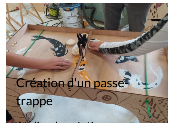
Création d'un passe-trappe

Atelier de création numérique et plastique.