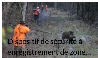
Dispositif de sécurité à enregistrement de zone...