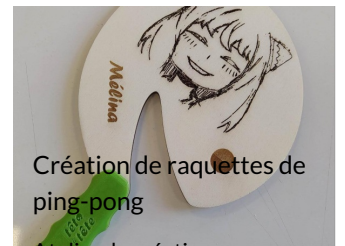
Création de raquettes de ping-pong

Atelier de création numérique et plastique.