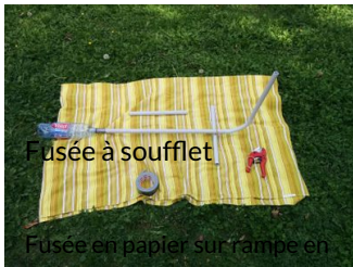
Fusée à soufflet