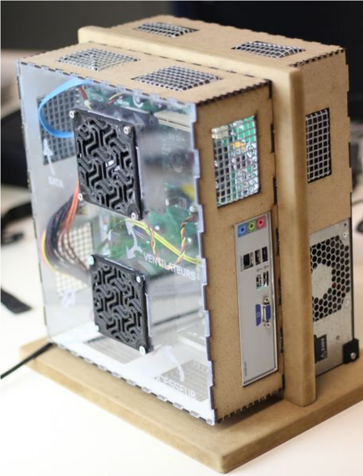
Taille de cet aperçu : 456 × 599 pixels. Fichier d'origine (3 456 × 4 543 pixels, taille du fichier : 2,96 Mio, type MIME : image/jpeg) Caisson_d'ordinateur_FaceA